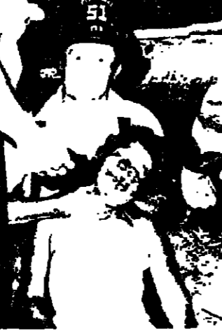
رجال اسعف ينظرون احصدي الضحايا